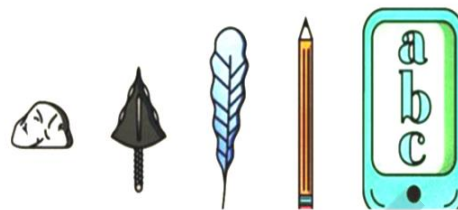
进化：我们的书写工具