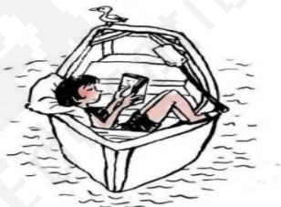
别害怕读书吃的苦 这是你通向世界最好的路

10. 暂现天体就像转瞬即逝的宇宙“烟花”，是宇宙中的剧烈爆发现象。2024 年 10 月，中国研制的科学卫星——爱因斯坦探针卫星发现一颗可能的新型暂现天体，该天体的光谱和时变特征与目前已知的天体类型均不完全一致。这一发现对拓展我们对宇宙暂现天体族群的认识以及理解极端物理过程具有重要的科学价值。材料说明