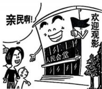
《双赢模式》（作者：吴登平）

3. 某市为盘活资源，在节假日期间利用人民会堂放映电影，弥补影院供给不足（如图）。此举是对官方场所商业模式的新探索。由此可推断（ ）