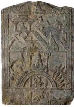
汉代画像石上的洒水捞鼎