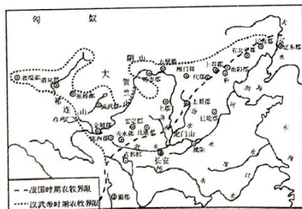
战国秦汉的农牧业分界线变迁图

上图的农牧界线在秦汉时期历经变化。秦始皇三十三年（公元前 214 年）派蒙恬逐匈奴，取得今河套包括鄂尔多斯高原的“河南地”，在这块一直是游牧民族活动的“草木茂盛，多禽兽”的森林草原地带，设置了 44 县，并修筑长城，“徙谪戍以充之”。公元前 217 年又迁三万家于北河（今河套乌加河）榆中地区。这两次大规模移民戍边，将农耕区的北界推进至阴山以南一带。不久，爆发了秦末农民起义，秦朝灭亡，戍边者乘机逃回，匈奴渡河而南，与中原王朝以战国以来的故塞为界。至汉武帝时期，农牧界线又向北移动。